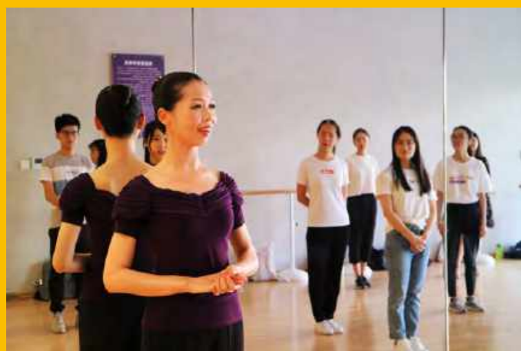
华尔兹老师进行现场指导

逸夫品味系列活动是逸夫书院自2017年3月起推出的系列活动,通过各式各样体验课的形式来培养学生的艺术素养,提高生活品味,旨在促进学生的全面发展、推行全人教育。