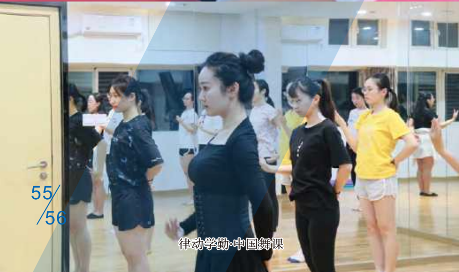
律动学勤·中国舞课