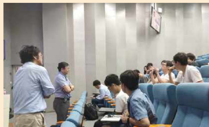
4月22日,台湾清华大学副校长吕平江教授带来“用圆排列解开蛋白质结”专题讲座。