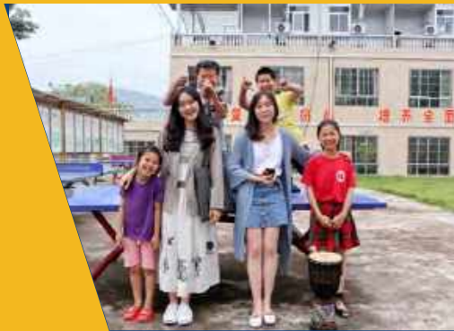
美丽中国校园大使团队广东梅州助教周

不知不觉,港中大(深圳)志愿者已经开展四年义教活动。2019年,我校共派出8支义教队分别前往云南保山、湖南常德、广东梅州和印尼坤甸开展助教义教。