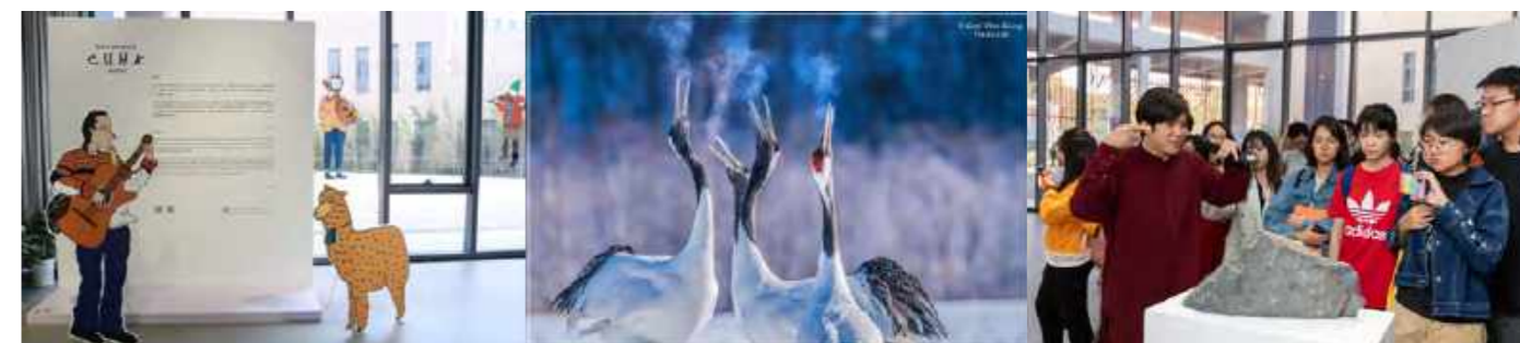
ICYTAN: People Watching@CUHK-Shenzhen