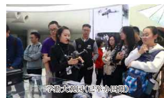
学勤大观园(已举办四期)