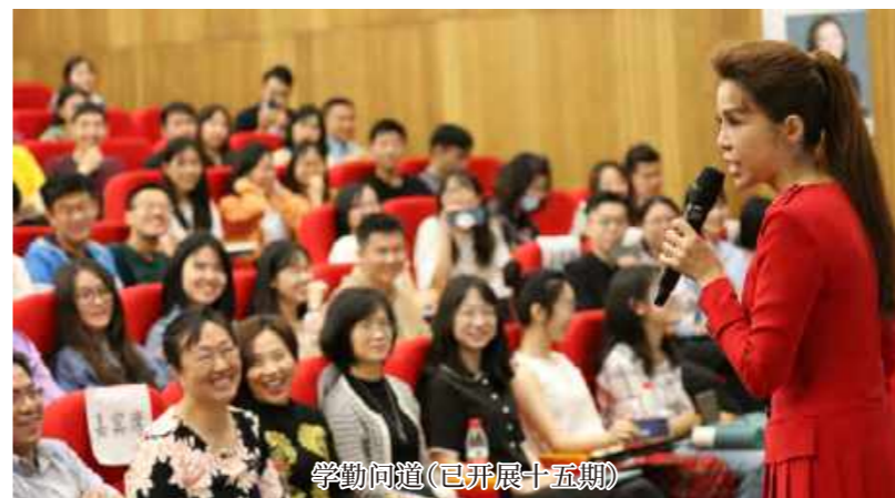
学勤问道(已开展十五期)

创院以来, 学勤书院始终秉持全人教育理念, 从归属感、主人翁意识、创新及进取精神、多元化视角及社会责任感五个维度开展丰富多彩的校内外全人教育活动, 使学生在德、智、体、群、劳诸方面得到情志身心的全面发展。截至目前为止, 学勤书院已持续开展八大“常规活动”, 并获得书院学生的的大力支持和踊跃参加。