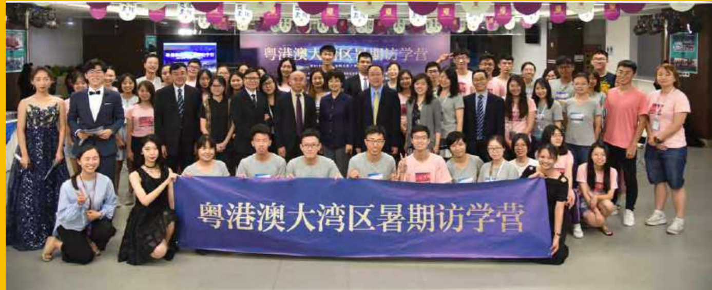
粤港澳大湾区大学生暑期访学营