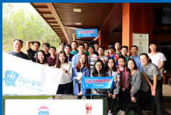
南科大树仁书院参加学勤高尔夫(2019年3月17日)

学勤书院积极推进与其他高校之间的交流合作,开阔学生视野,培养学生社交与团队协作能力,促进友谊,共同发展。