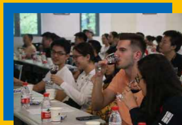
同学现场品尝葡萄酒