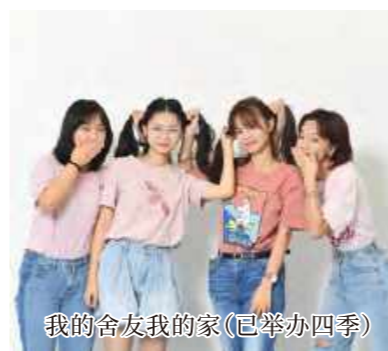
我的舍友我的家(已举办四季)