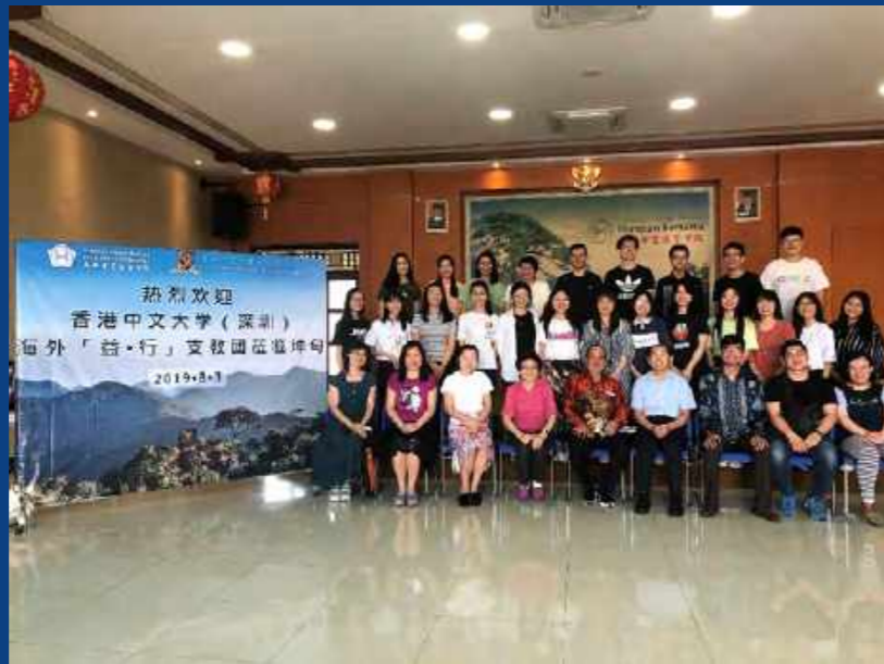
下南洋·印尼坤甸华文义教队