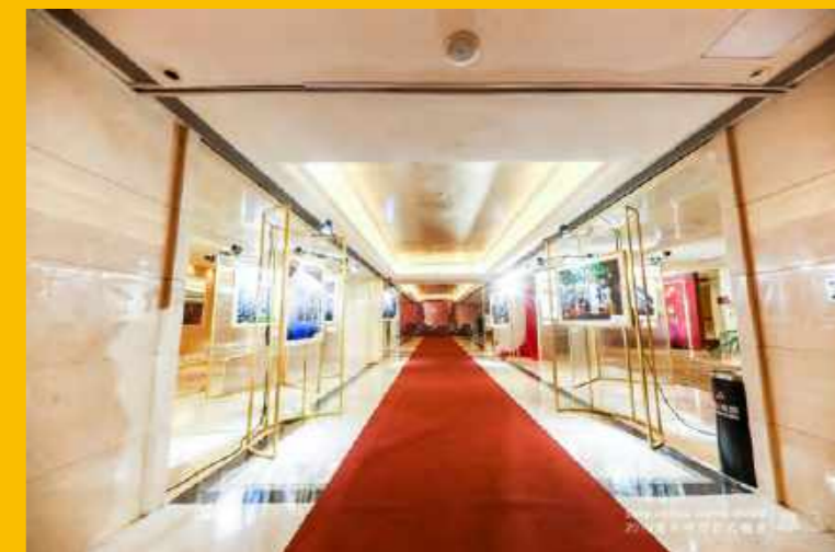
逸夫书院正式晚宴上摄影作品展示区域