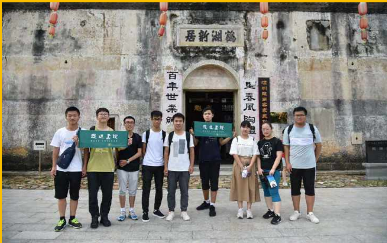
City 初相识 | 思廷书院 Shenzhen City Walking Tour