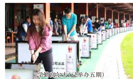
学勤高尔夫(已举办五期)