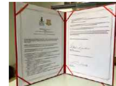
签署的战略合作备忘录

2019年5月1日,逸夫书院与澳大利亚昆士兰大学国王书院签署了战略合作备忘录(MOU)。此后,双方一直寻求合作交流机会,并计划于2020年初开展为期一周的“探访澳洲顶尖学府——昆士兰大学”澳洲游学项目。