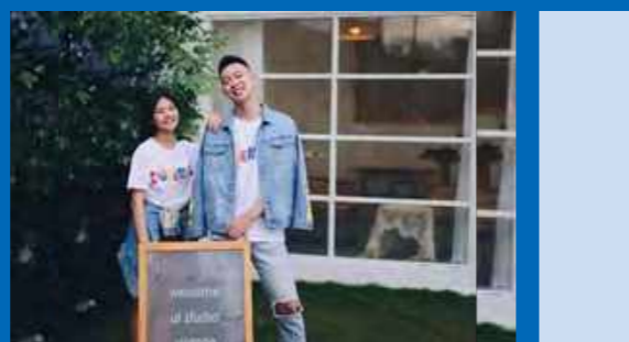
2019新款书院院服及牛仔衣

2019年学勤书院继续推出文创及书院周边纪念品,包括从开学时沿袭了去年设计灵感的书院外型立体 Welcome Letter、运动T恤和定制大礼包,再到学勤三周年院庆活动和高桌晚宴,诸多设计品收获了师生的一致好评,并进一步促进了师生书院文化归属感。