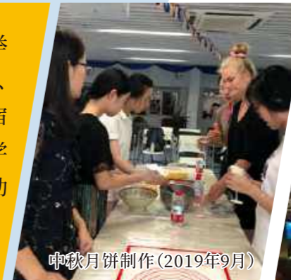
中秋月饼制作(2019年9月)

宿舍导师定期在所在楼层举办活动。楼层活动除了楼层聚会、师生茶话会以及电影聚会等,宿舍导师也邀请自己的朋友分享学习工作经验、积极组织户外活动等。