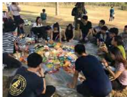
C栋火锅派对 D栋户外野餐