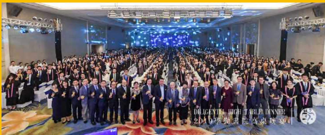
2019学勤书院高桌晚宴(2019年11月29日)

秉承香港中文大学(深圳)中西方文化融合的教育传统, 拓宽同学们的视野, 学勤书院举办一年一度最大规模的高桌晚宴。值得一提的是, 在2019年的高桌晚宴上, 腾讯创始人之一曾李青先生为同学们带来了有关“曾李青定律”的主旨演讲并给予大家宝贵的“三个建议”。另外, 学勤无与伦比合唱团为在场的师生们表演合唱《贝加尔湖畔》让这场盛会别具意义。