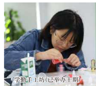
学勤手工坊(已举办十期)