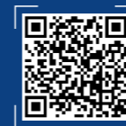
机器人与智能制造研究院