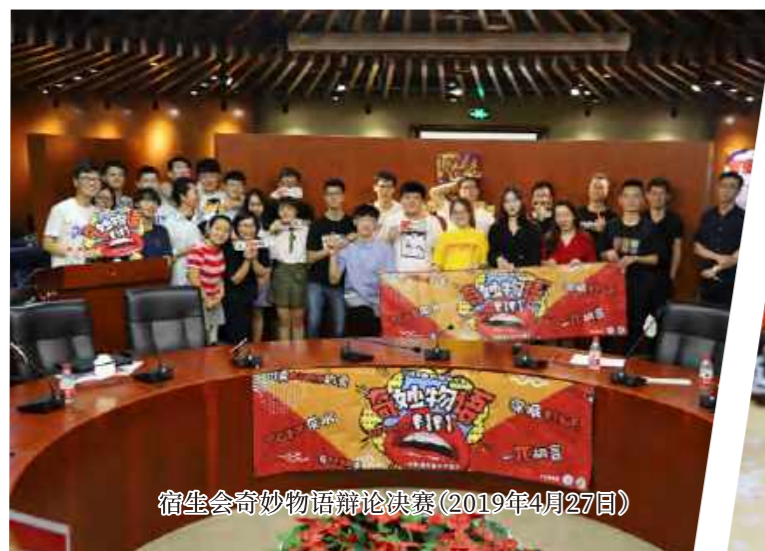
宿生会奇妙物语辩论决赛(2019年4月27日)

学勤书院宿生会是以学生为主导的、重要的书院学生组织。宿生会致力于打造三大平台——信息沟通和反馈平台、资源共享平台和宿生管理平台，为各位小精灵的书院生活“保驾护航”。