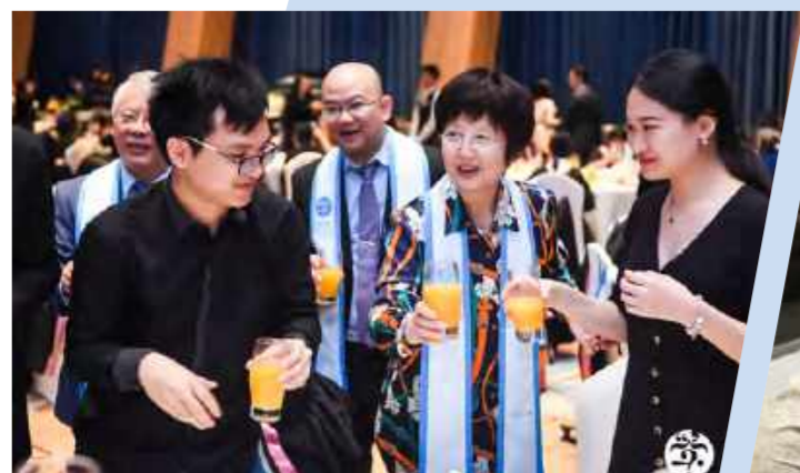
2019毕业生晚宴(2019年5月7日)