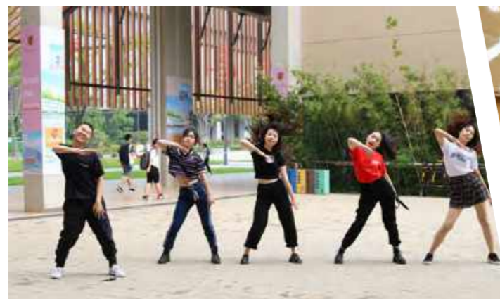
书院三周年快闪《歌舞青春,礼乐学勤》 (2019年10月14日)

2016.10.14-2019.10.14,学勤书院栉风沐雨,砥砺前行,终于迎来书院三周岁生日。为纪念这个特别的日子,书院特别举办“院庆周”系列活动,横跨制造业、前沿科技、美食DIY、情感心理、社会公益、户外运动等各个领域。学勤书院一直秉持着全人教育理念,旨在通过多姿多彩的活动,让同学得以不断提升自我,磨砺自我,放松自我,从而在一次次宝贵的经历中完善成为一个富有爱心、思维敏锐、身体健康、阳光积极的人。