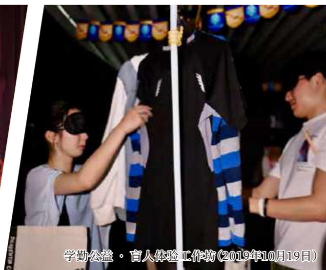
学勤公益·盲人体验工作坊(2019年10月19日)