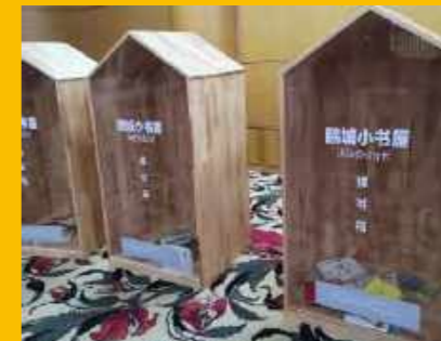
“鹏城小书屋”流动捐书计划