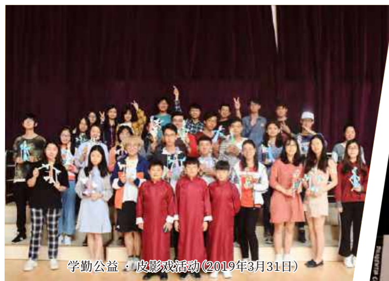
学勤公益·皮影戏活动(2019年3月31日)

Open Rain是学勤书院成立的公益组织,通过发现、关注并深入了解甚至参与解决各种社会问题,组织各类公益活动,引导同学积极主动地为社会贡献自己的一份力量,提升同学的责任感和公益观。