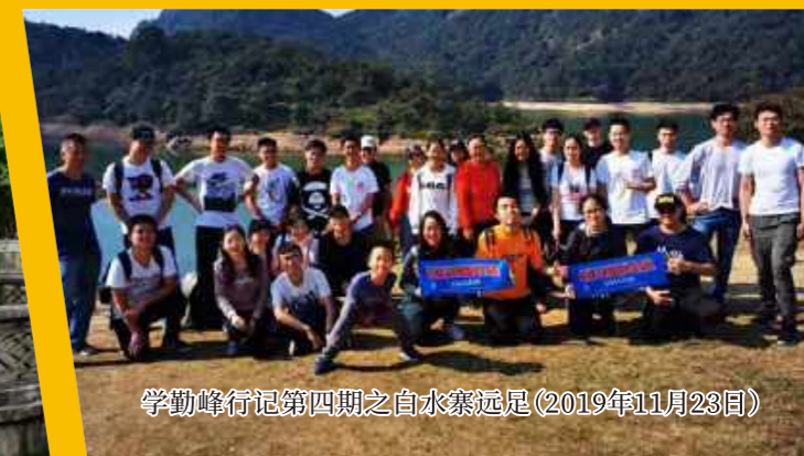
学勤峰行记第四期之白水寨远足(2019年11月23日)