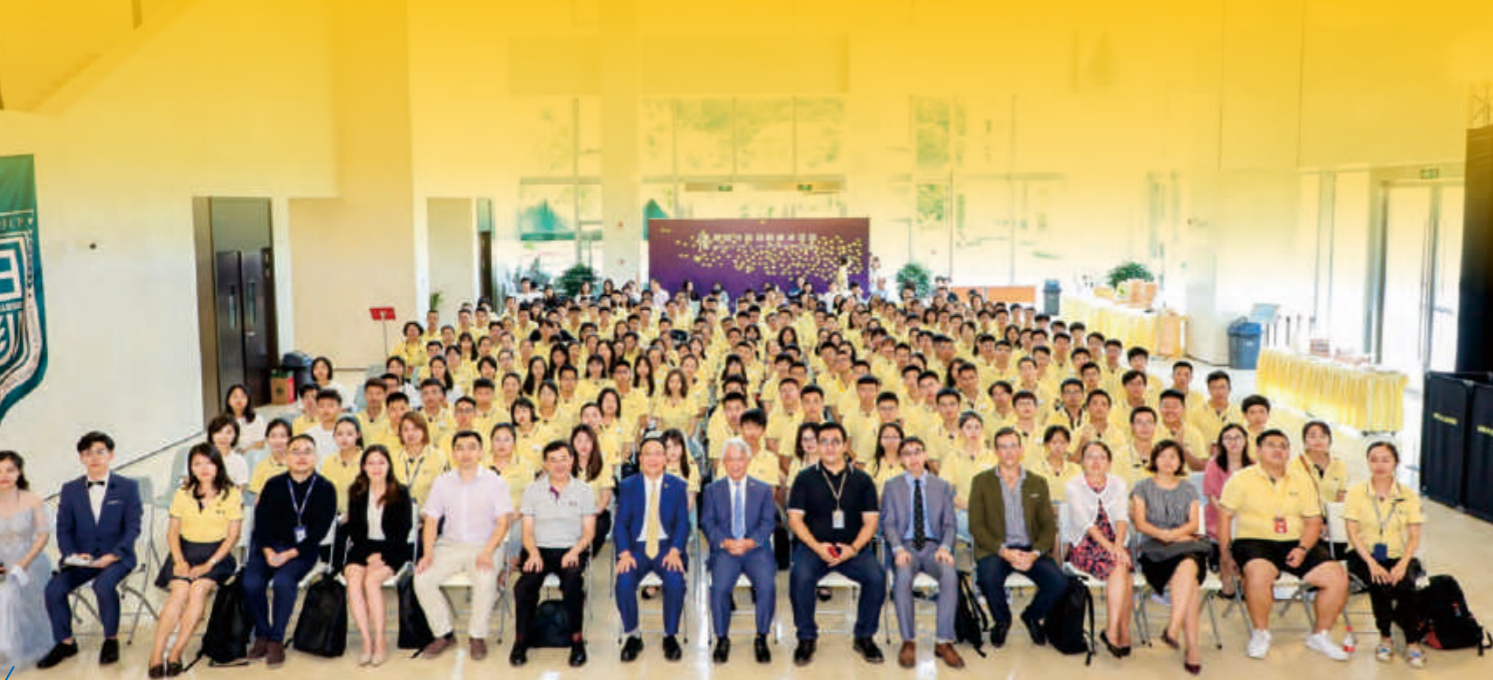
2019年思廷书院迎新系列活动