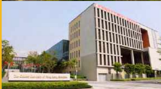
香港中文大学(深圳)二期项目由深圳市政府投资建设,建筑面积约26万平方米,预计2023年6月份交付。