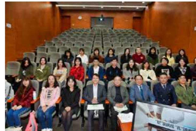
“职”面挑战，“礼”遇未来