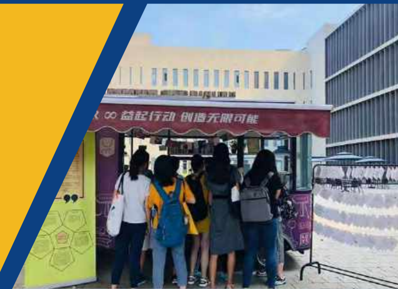
2019公益周——悬赏可持续大师