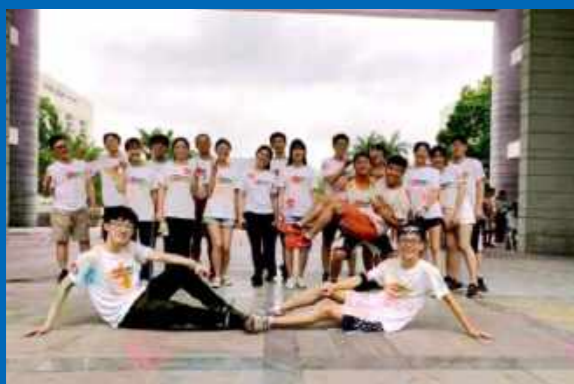
学勤宿舍会受邀参加哈工大(深圳)越野活动(2019年4月21日)