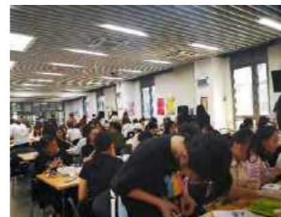
E栋、F栋中秋月饼制作