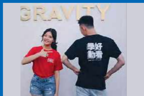
学勤三周年定制“学勤好看”T恤