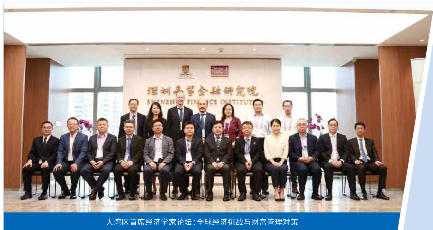
大湾区首席经济学家论坛:全球经济挑战与财富管理对策

香港中文大学(深圳)经管学院常年举行学术研讨会议,邀请校内外教员与学者共同开展学术讨论。为服务社会,践行学界与业界沟通之职责,研讨会亦对公众开放。2019年度共计举行117场学术研讨会,其领域涉及金融、经济、运营管理等。