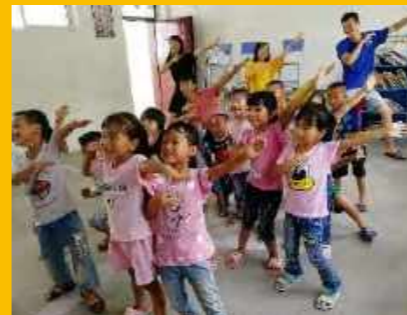
贵州省黔东南州榕江县朗洞镇高略村 顺丰莲花小学支教服务