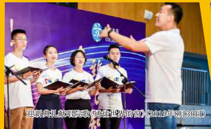
迎新典礼献唱院歌《通往世界的窗》(2019年8月30日)

学勤无与伦比合唱团于今年九月初登迎新典礼,11月29日,三十余人的完整体在高桌晚宴进行了表演。合唱团让热爱音乐的人聚集在一起,让老师和同学们在音乐的浸润下逐步加深对于彼此以及书院的了解。