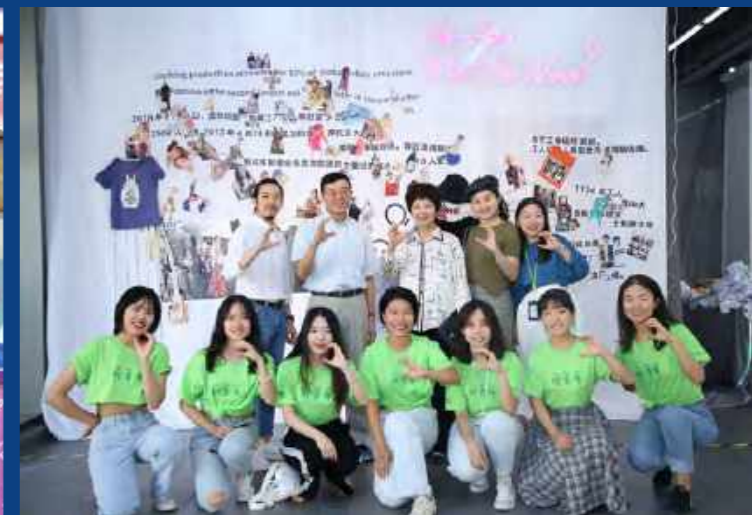
2019第三届香港中文大学(深圳)“持续·改变·生活”公益周《延续》主题展览