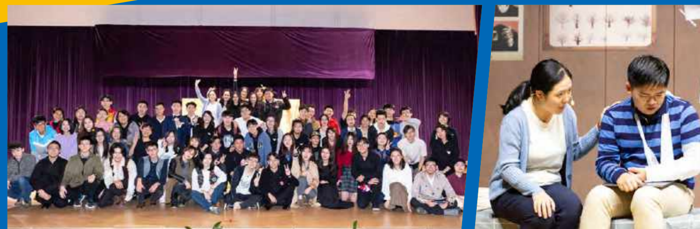
学勤魅影戏剧节暨年度大戏《亲爱的埃文》(2019年1月18-20日)

【学勤魅影戏剧节】于2019年1月18-20日举办,通过戏剧快闪、市集、工作坊和舞台剧等多种形式带领同学进入戏剧的世界。活动旨在通过戏剧与现实的互动与交融,让同学们领略戏剧的独特魅力。