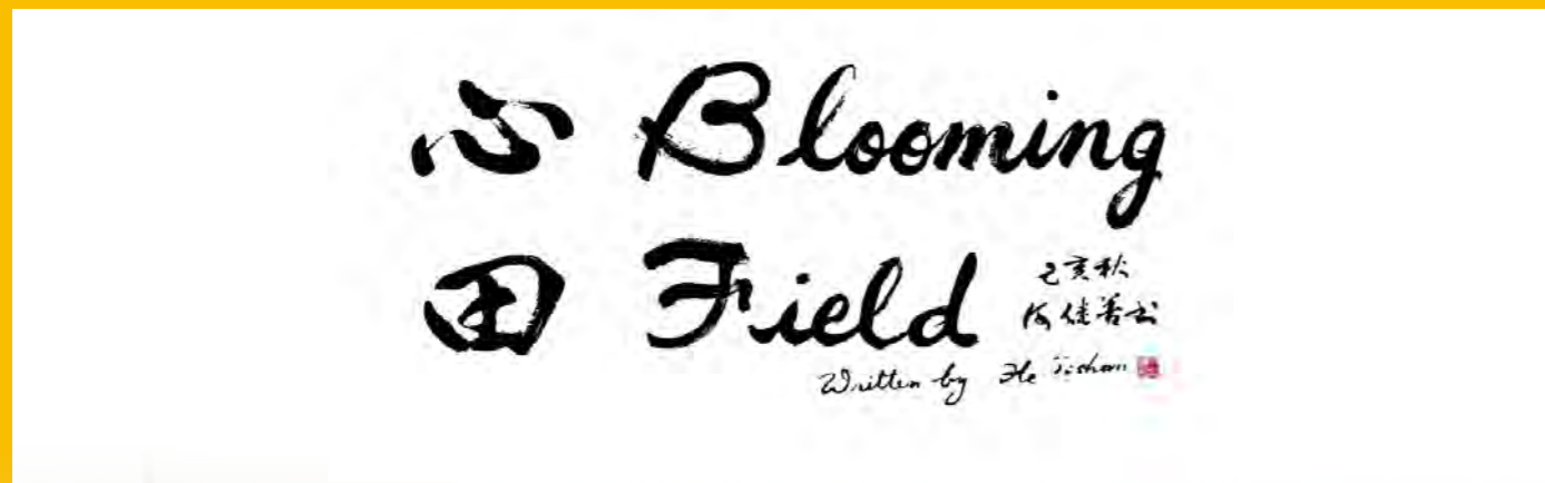
Muse Newsletter | 心田 Blooming Field(第一期发布)