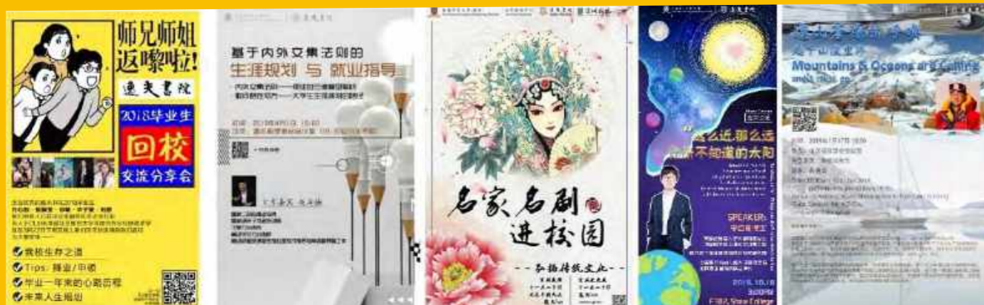
「逸闻论道」系列活动海报

「逸闻论道」系列讲座旨在邀请不同领域学科的专家、学者和经验丰富的行业从业人员走进逸夫，与逸夫的师生一起交流探索，自由表达。2019年，逸夫书院共举办5场逸闻论道系列讲座。