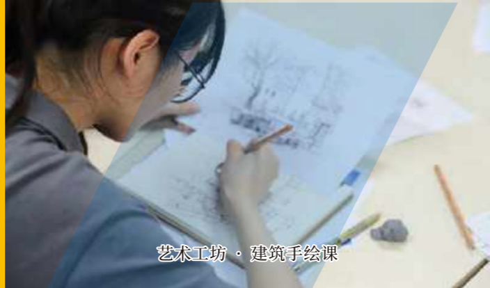
艺术工坊·建筑手绘课