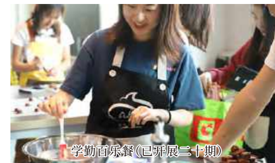
学勤百乐餐(已开展二十期)