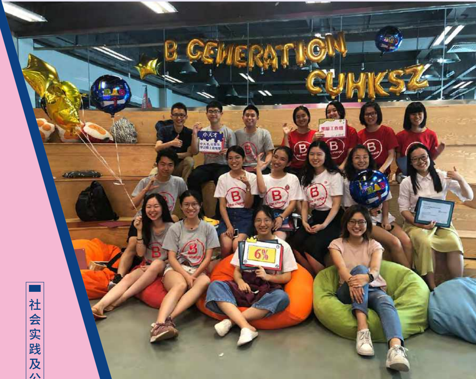
2019共益商业青年领导力项目(B Generation)