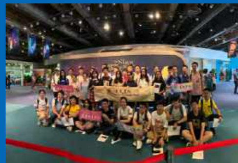
逸夫师生在邵逸夫奖科学论坛的合影

逸夫书院每年都会举办一场活动来庆祝世界各地的传统节日,以达到增强学生的全球意识和全球性观念的目的,并希望以此激发学生对世界上其他文化的好奇心。1月11日,逸夫书院2019法式新年派对在F301拉开帷幕,开启了浪漫的法兰西旅程。