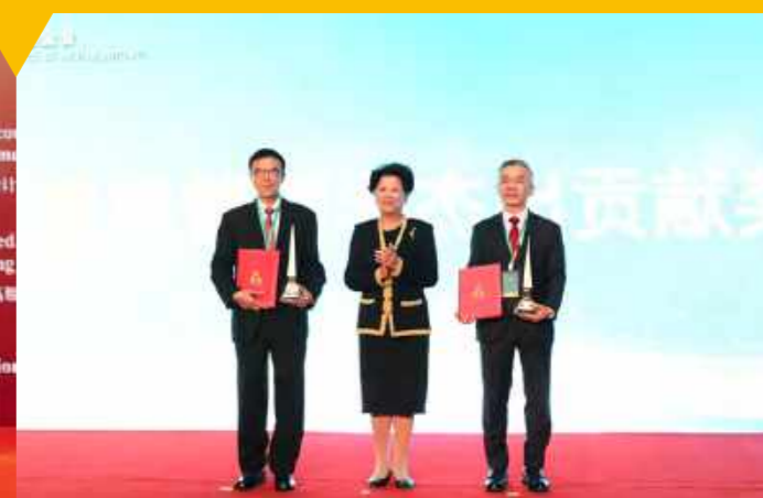
经管学院校长讲座教授贾建民荣获2019年“复旦管理学杰出贡献奖”

10月21日,经管学院校长讲座教授贾建民因其在管理学领域做出的杰出贡献,荣获2019年“复旦管理学杰出贡献奖”,同时获得该奖项的还有清华大学经济管理学院杨百寅教授。