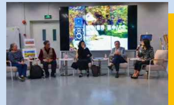
镜中/世界, 画中/人生