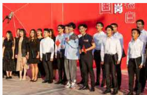
合唱团应人民网邀请参与全国首个“人民红·向祖国表白”快闪店开幕日表演