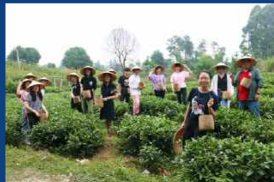
2019暑期成都社会创新训练营

社会创新研习营活动为学生事务处社会实践中心“公益领导力提升”项目的活动之一。该活动旨在对公益和社会创新领域有所实践和有想法的同学进行进一步的赋能。在该训练营中,学生可通过参访相关组织、机构和高校进行交流合作、开拓眼界;通过行业内大咖、导师分享增加对专业领域的认知;通过每日分享、反思,并结合自己的专业所学提升自我综合能力。