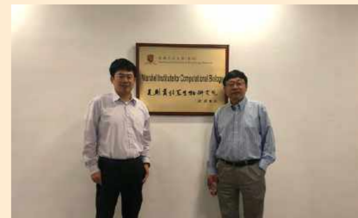
12月18日,香港中文大学生物医学学院教授、心脑血管医学研究所所长黄聿教授做“血管的健康与疾病”专题讲座。