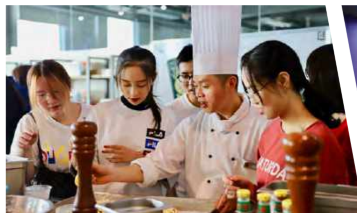
学勤百乐餐:我用pizza为书院庆生 (2019年10月15日)