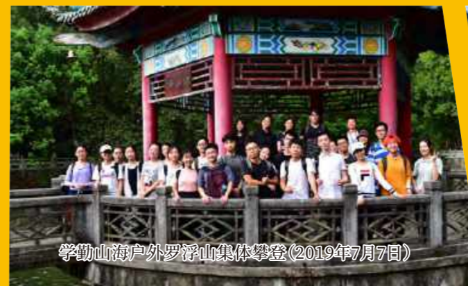
学勤山海户外罗浮山集体攀登(2019年7月7日)

2019年3月,学勤书院山海户外协会正式成立,协会旨在“探索自然,无限开拓户外体验”,鼓励同学们走出舒适圈,“Step Out to the World”。山海户外协会将带同学们走出只读圣贤书的象牙塔,与志同道合的伙伴们一起感受大自然的美妙,释放自己,开拓思路,舒展情怀,感悟生活的美好。