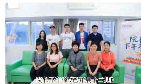
院长下午茶(已开展十二期)