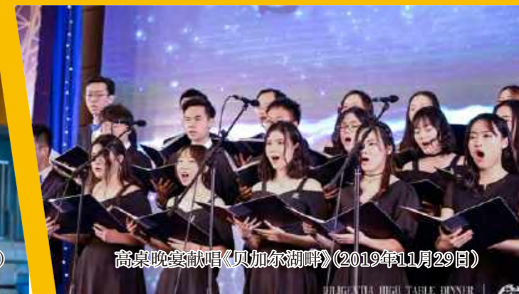
高桌晚宴献唱《贝加尔湖畔》(2019年11月29日)