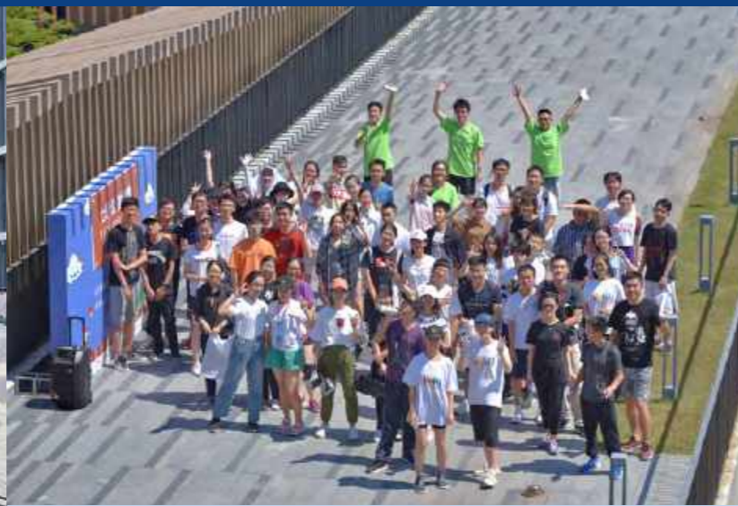
2019 Run for Good七彩公益探索