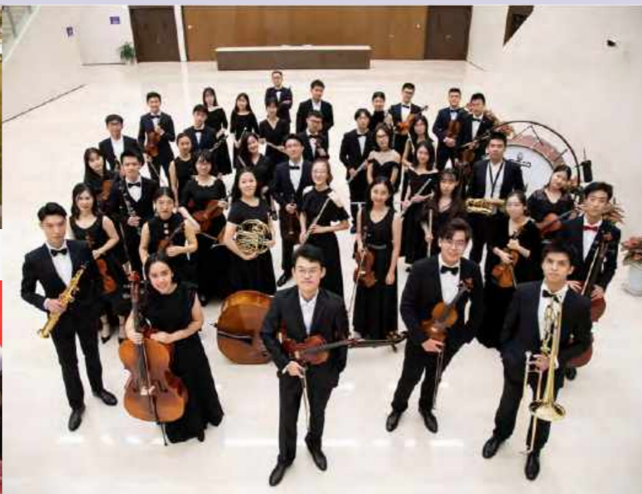
艺术团体-管弦乐团