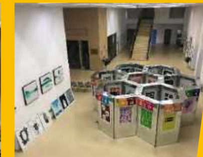
“家·园”作品展暨学生摄影展