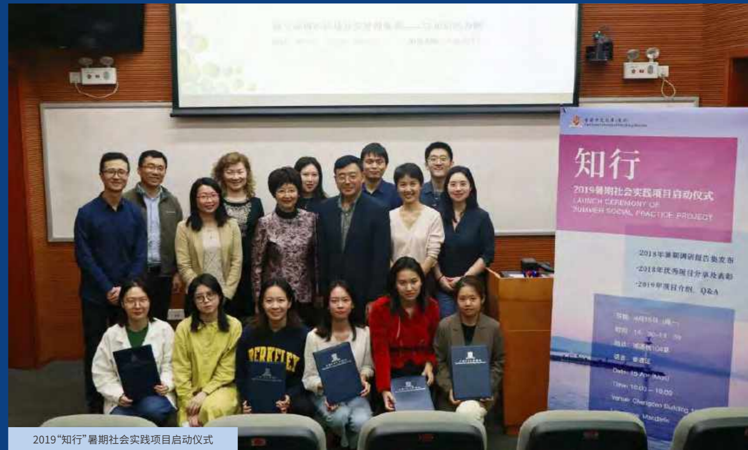
2019“知行”暑期社会实践项目启动仪式