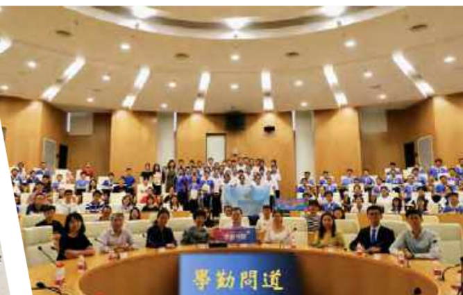
学勤问道三周年特辑与刘玠院士一同 “走进钢铁世界”(2019年10月12日)