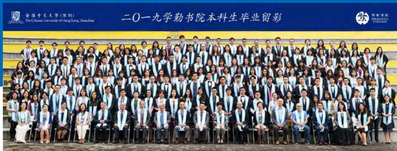
2019学勤书院本科毕业留影

2019年5月,学勤书院迎来了第二届本科毕业生,书院通过“毕业生分享会”、“院长下午茶毕业生专场”、“毕业晚宴”、“跳蚤市场”等一系列活动祝福毕业生前程似锦,也希望印刻着学勤院徽的毕业纪念品能在离开书院的岁月里继续陪伴他们。