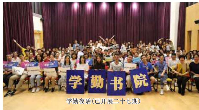
学勤夜话(已开展二十七期)