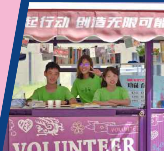
2019 Run for Good七彩公益探索志愿者