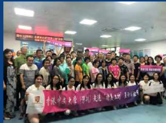
微光公益志愿者探访龙城街道残疾人(综合)康复中心

我校与龙城街道积极探索“高校”+“社区”智慧助残模式,为促进残疾人身心康复、创业就业、社会融入等方面的工作进行尝试。香港中文大学(深圳)老师及学生志愿者共30多人走进龙城街道残疾人职业(综合)康复中心“特美工坊”,开展“体验式助残”和“特美老师,您好”特色活动。