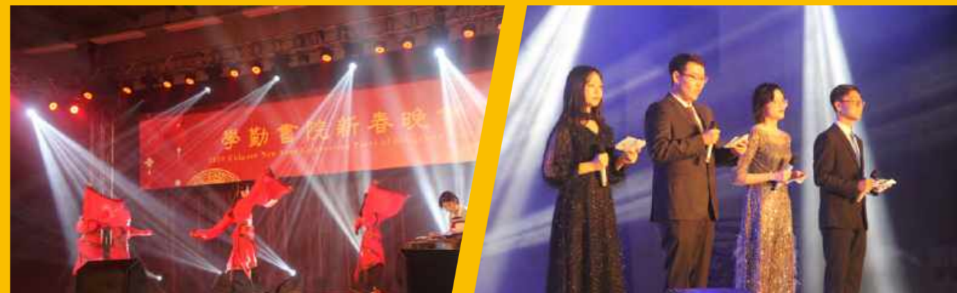
学勤宿生会举办2019学勤书院新春晚会(2019年1月13日)

【学勤书院新年晚会】是学勤书院宿生会的传统活动,旨在与书院学生共度佳节,增强书院同学对书院的归属感,带动同学们的主人翁意识。已成功举办三届。