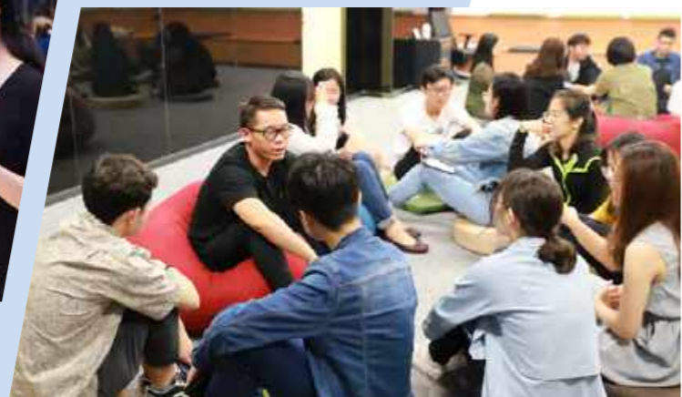
毕业生分享会(2019年4月18日)