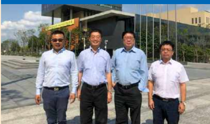
4月23日,深圳大学医学部主任、医学院院长朱卫国教授(下图右二)来到我校开展“组蛋白修饰与DNA损伤修复”专题讲座。