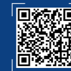
深圳高等金融研究院