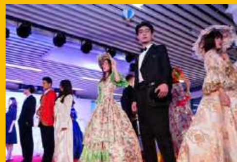
法式新年派对活动现场

逸夫书院每年都会举办一场活动来庆祝世界各地的传统节日,以达到增强学生的全球意识和全球性观念的目的,并希望以此激发学生对世界上其他文化的好奇心。1月11日,逸夫书院2019法式新年派对在F301拉开帷幕,开启了浪漫的法兰西旅程。