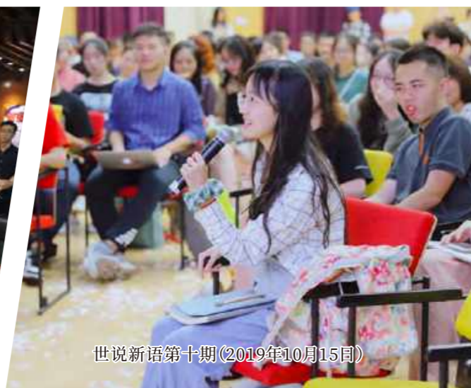
世说新语第十期(2019年10月15日)