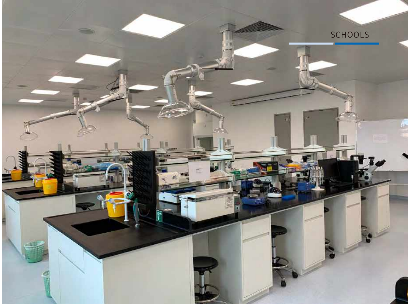
已投入使用的生物化学教学实验室(实验楼A栋407室)